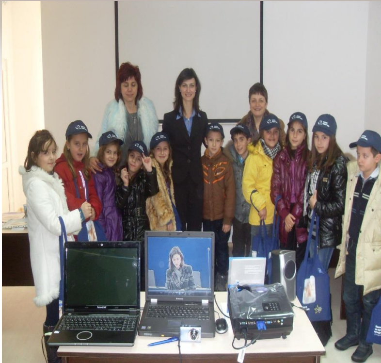
Посещение на Мария Габриел.