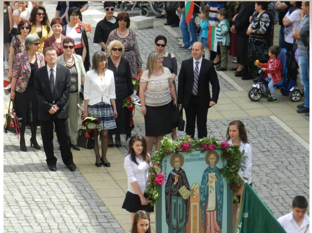
Манифестация по случай празника на българската писменост и култура – 24 Май!